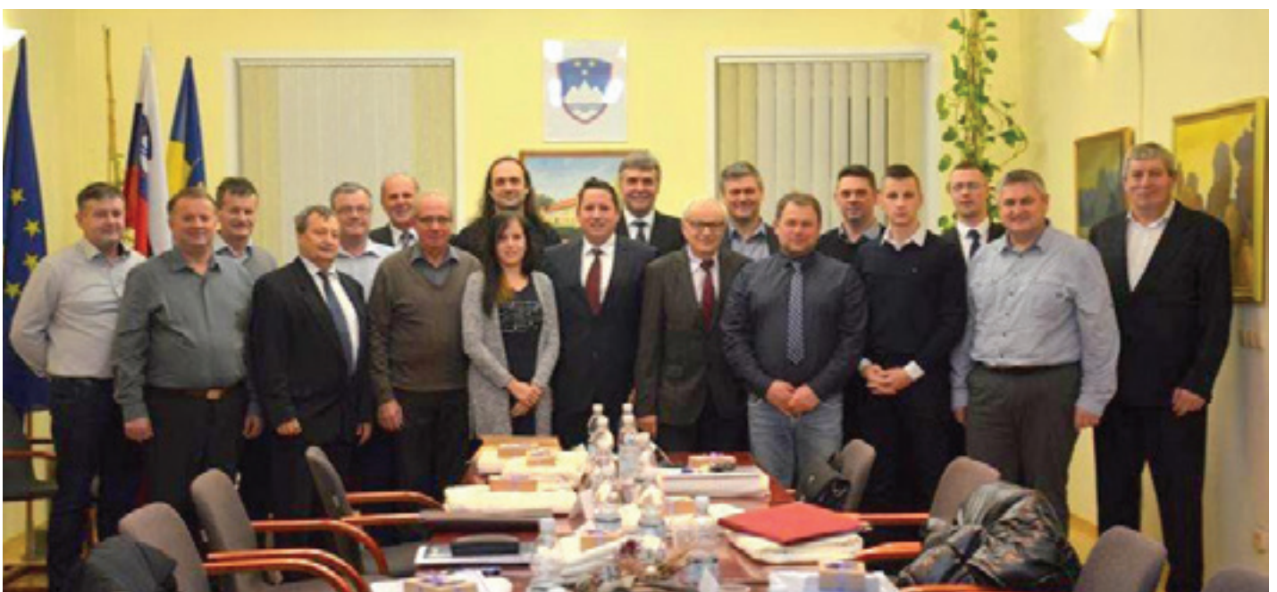
Župan in člani občinskega sveta Občine Beltinci v mandatnem obdobju 2018 - 2022