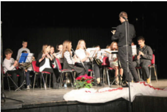
Orkester Glasbene šole Beltinci