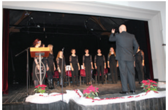
Ženski pevski zbor Biser, Kulturnega društva Grosuplje