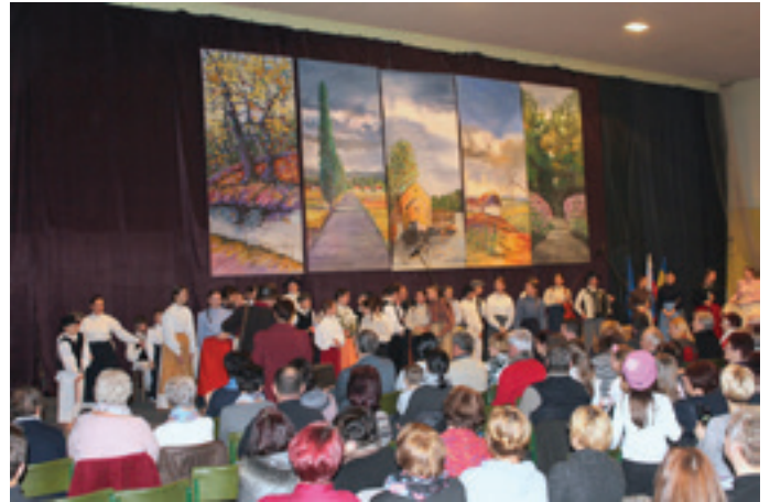
Slovenski kulturni praznik v OŠ Beltinci