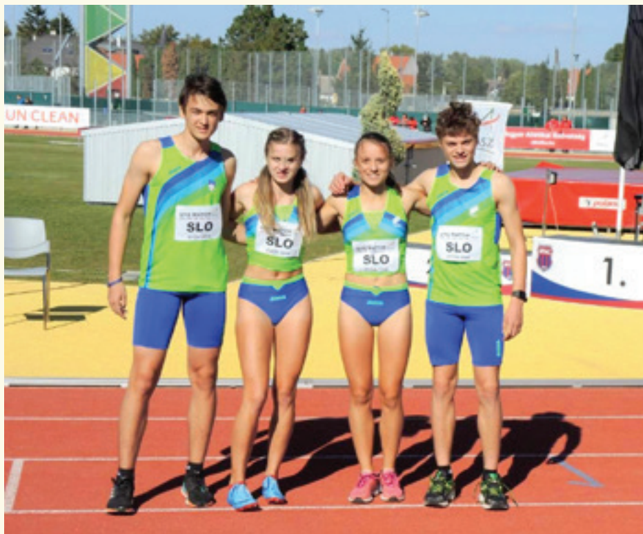
Maj s srebrno slovensko štafeto 4x300m, Győr