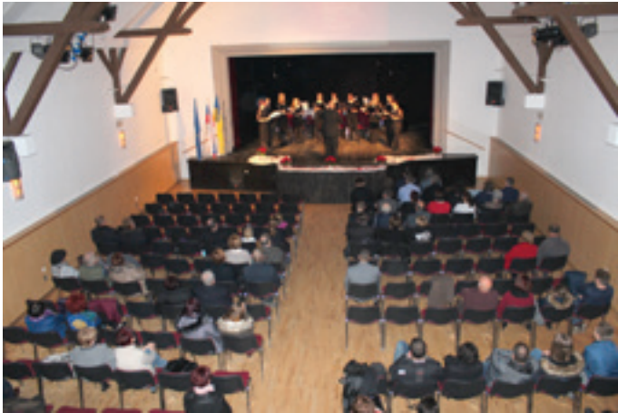
Osrednja občinska proslava ob Dnevu samostojnosti in enotnosti