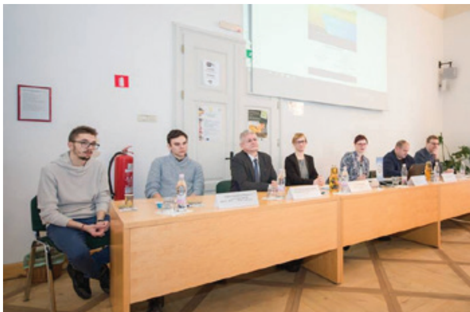
7. okrogla miza DPAE

komunikacijo pri DIH Agrifood, je povedala, da DIH Agrifood – Digitalno inovacijsko stičišče za kmetijstvo in proizvodnjo hrane združuje slovensko ter evropsko raziskovalno in razvojno strokovno znanje s področja kmetijstva in proizvodnje hrane. Mreža organizacij ponuja najnovejše znanje o digitalizaciji te panoge – tako imenovanega pametnega kmetijstva. Cilj DIH Agrifood je podpirati razvoj kmetijstva in proizvodnje hrane ter zagotavljati varno, trajnostno in kakovostno hrano. Skupaj z deležniki ga je leta 2017 ustanovil ITC – Inovacijsko tehnološki grozd Murska Sobota. DIH Agrifood predstavlja »one – stop – shop«, ki zagotavlja storitve za ciljne skupine, npr. kmete, preko multipartnerskega medsektorskega sodelovanja. Članstvo je odprto za vse organizacije, ki podpirajo poslanstvo DIH Agrifood. V mreži DIH Agrifood so trenutno organizacije za podporo podjetjem, zbornice, znanstvene in raziskovalne organizacije, mala in srednja podjetja, zadruga in nevladne organizacije. Vizija DIH Agrifood je postati vodilna mreža v Sloveniji pri razvoju, prenosu tehnologije in inovativni uporabi pametnih