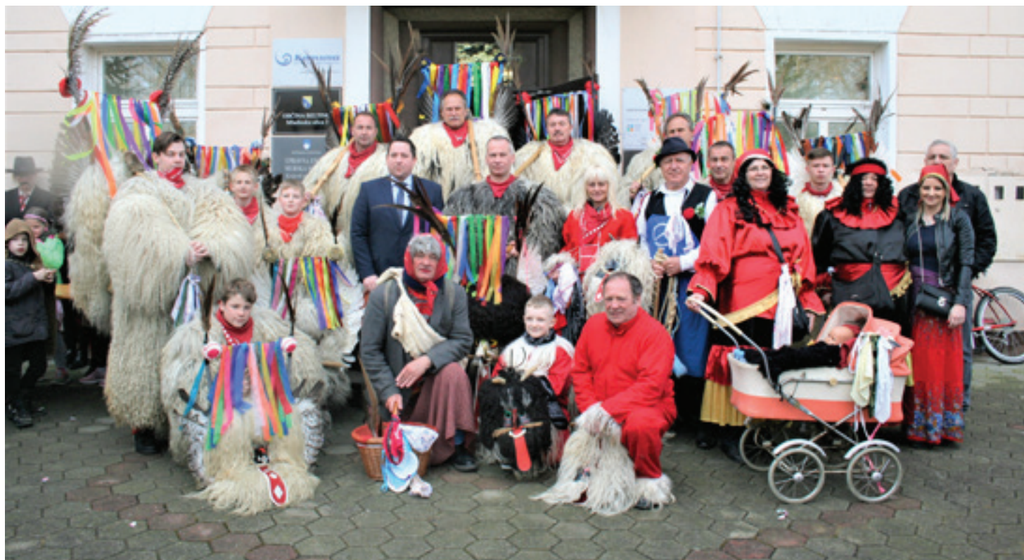
Obisk kurentov Etnografskega društva Ježevka s Ptuja, pred občinsko stavbo

Koncert snema RTV Slovenija za potrebe dokumentarnega filma Feri.