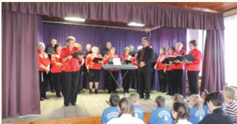
V Porabju smo gostovali 9. 2. 2019